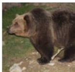
Årets björnjakt i länet är stoppad då kvoten på 80 björnar är fylld.

LÄNET. Med start den 21:a augusti startade björnjakten i år för att avslutas vid 11-tiden i söndags. Då, efter tolv dagars jakt, var kvoten på 80 björnar fylld. Därmed är björnjakten avklarad fram till den första oktober i år då ytterligare fem björnar får skjutas, då endast i ett nordligt område inom Örnsköldsviks kommun mot länsgränsen. Tyngsta björnarna som fallits hittills i år är en hane på 208 kilo i Kramfors och en hane på 205 kilo i Sollefteå. Av de 80 fällda björnarna har 61 fallits inom Örnsköldsviks kommun.