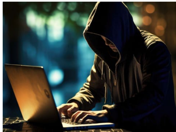
Digitaliseringen har öppnat dörren till digitala bedrägerier.