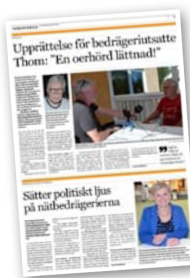
Nordsverige 22:a augusti 2024.